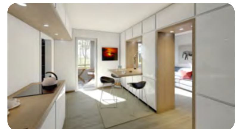
Visualisierungen von H2 ARCHITEKTUR by hendrik heine