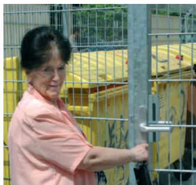
Der Standplatz im Sommer 2016 ... und ein Jahr später mit verschließbarem Zugang