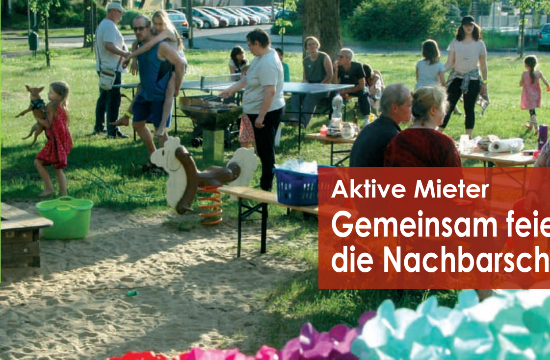
Fest der Nachbarn am Spartakusring: Freiluftspiele und Grill brachten große und kleine Nachbarn zusammen.